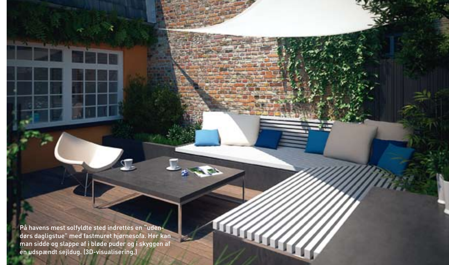
På havens mest solfyldte sted indrettes en "udendørs dagligstue" med fastmuret hjørnesofa. Her kan man sidde og slappe af i bløde puder og i skyggen af en udspændt sejldug. (3D-visualisering.)

Oven over sofabjørnet udspændes en sejldug for at give skygge for solen i dagstimerne. Sejlet skærmer også af for duggen og er dermed med til at forlænge de lyse sommeraftener. Det hvide lærred virker nærmest som et lille tag, der gør det muligt at overnatte udendørs, hvis man skulle få lyst til dét. Møblelementet med sofa og bord suppleres ganske enkelt med et par ekstra borde, hvorpå der lægges madrasser – og så har man på en nem måde transformeret rummet til et udendørs puderum!