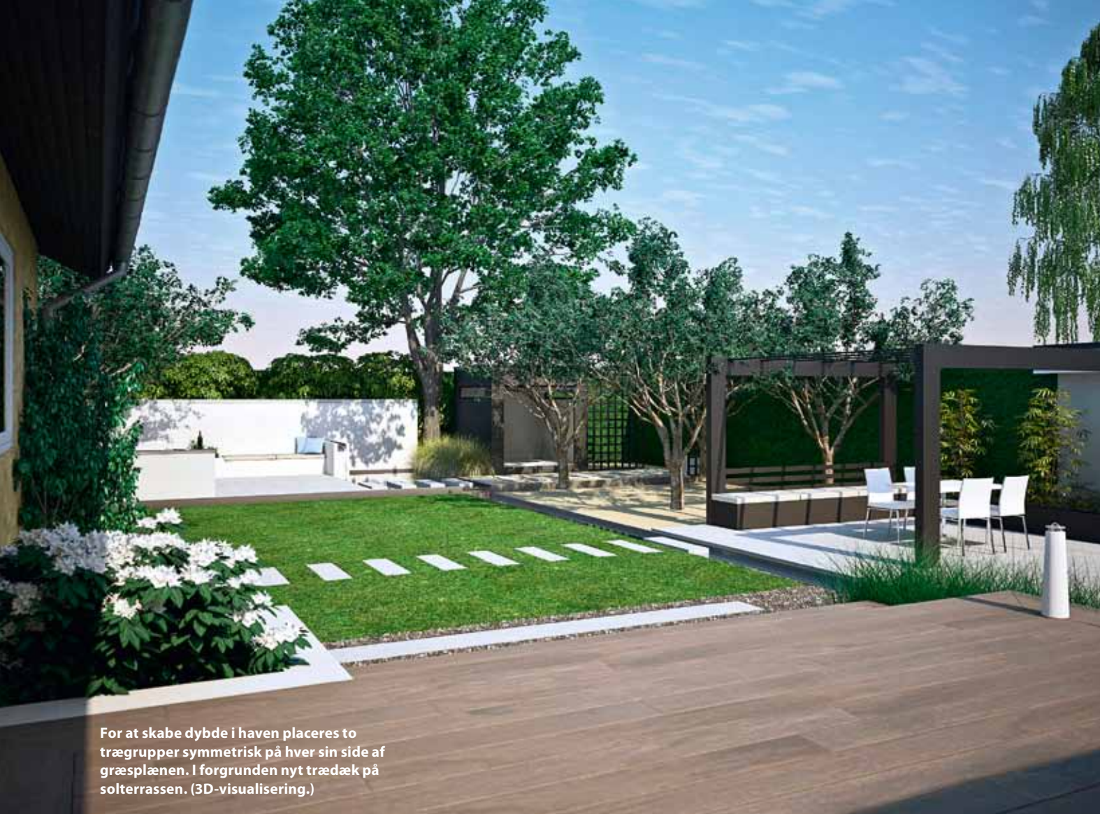
For at skabe dybde i haven placeres to trægrupper symmetrisk på hver sin side af græsplænen. I forgrunden nyt trædæk på solterrassen. (3D-visualisering.)