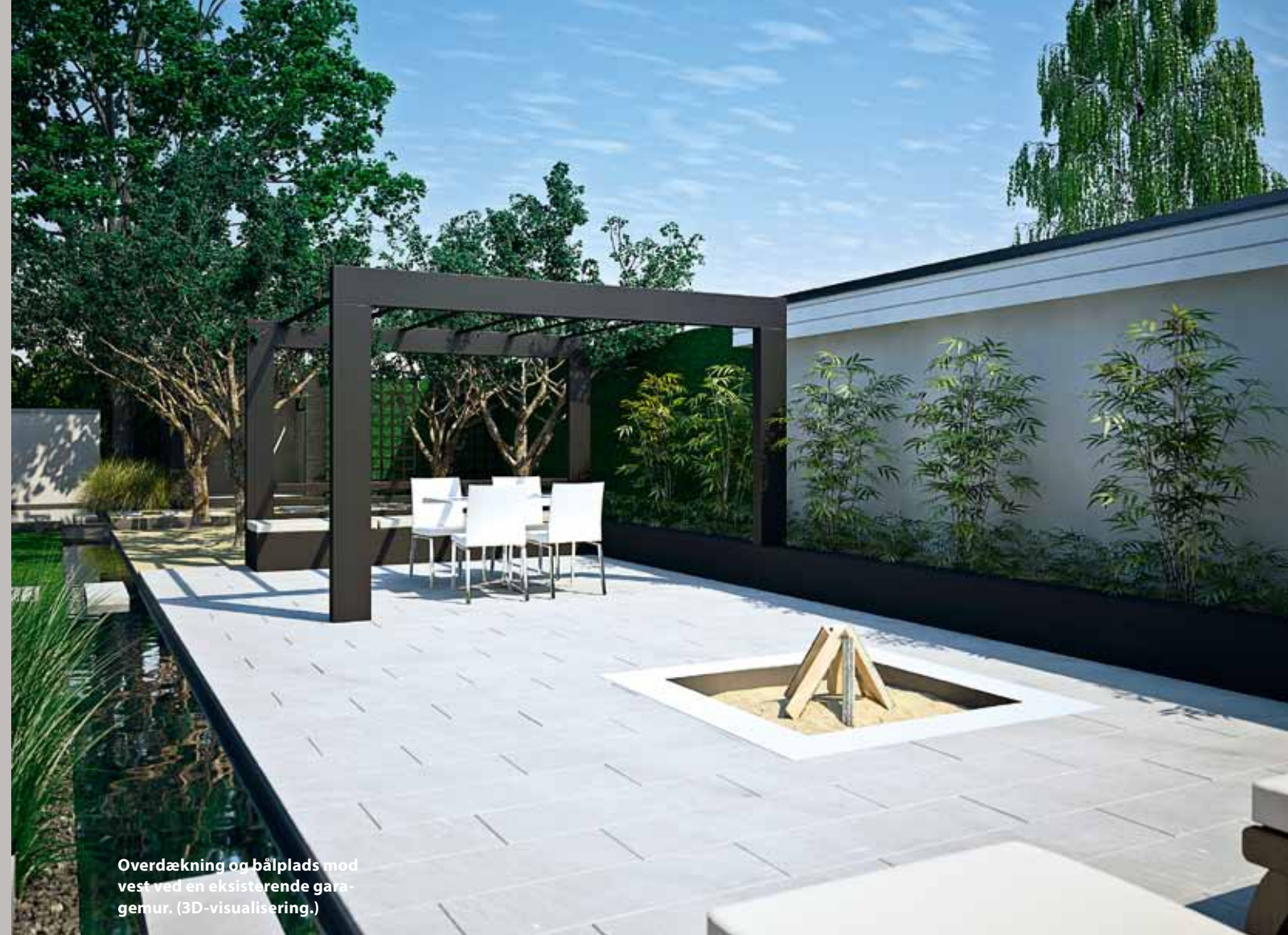
Overdækning og bålplads mod vest ved en eksisterende garage-mur. (3D-visualisering.)